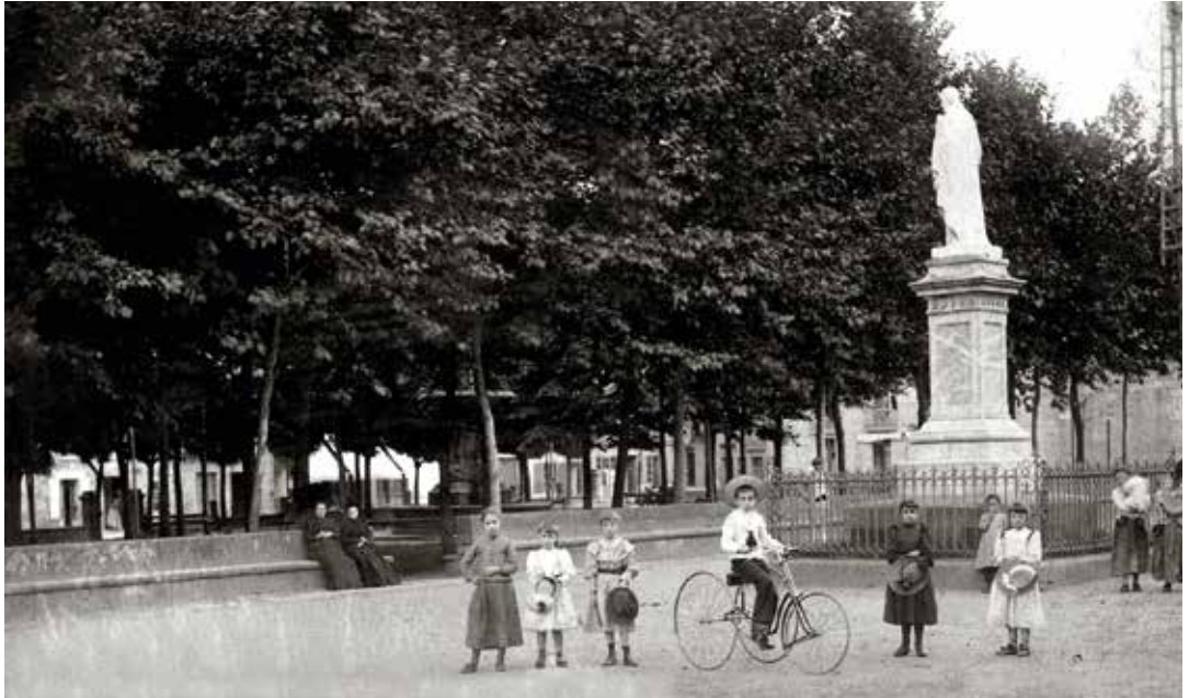
Plaza de Ezkurdi de Durango (Circa 1895).