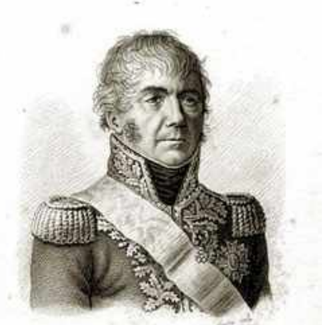
🕒 Mariscal Lefebvre, jefe del ejército francés.