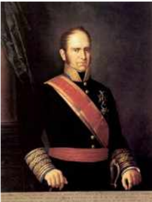
🕒 Joaquín Blake, jefe del ejército español.

Aldi berean, Lefebvre mariskalak beste eraso bati ekin zion, Joaquín Blakeren posizioen erdialdetik eta ezkerreko hegaletik sinkronizatuta, bere ofizial gogorrenen bidez: Sebastiani eta Leval, hurrenez hurren. Ondorioz, Blakeren soldaduen lehenengo lerroak atzera egin behar izan zuen gizon gehiago ez galtzeko, eta unitate frantsesak Amorebietan bertan sartu ziren. Artean, San Miguel eta San Martin mendietako posizioak galdu ziren. Arago. Ibaizabalen ertzak alde bietako zenduez bete ziren, eta Arrindako kokapen estrategikoa ere ordu batzuk lehenago jausi zen.