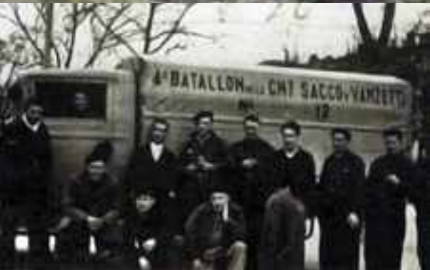
🇪🇸 Soldados anarquistas Vascos en la guerra civil.