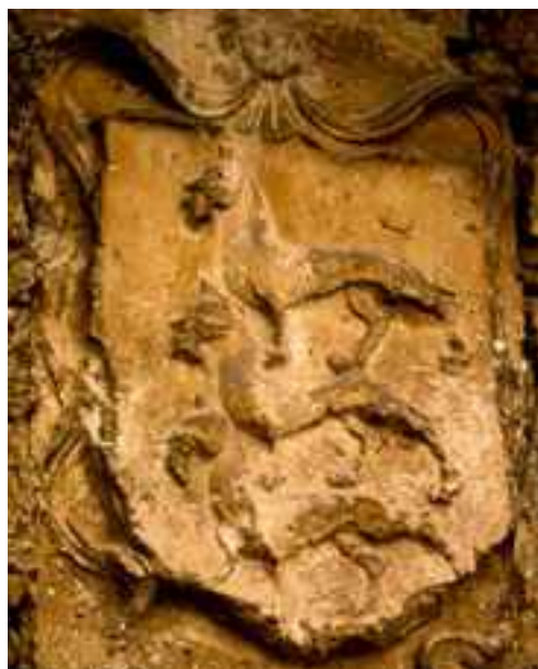
📍 Zaldua leinuaren armarría.

Zaldibarrek ez dauka zehaztuta zein den udalerriko armarría ze, gaur egun erabiltzen denak, 1976an arbitra-